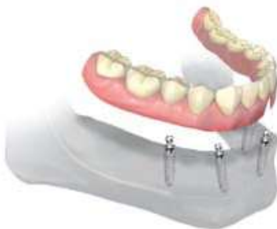
De klikprothese wordt vastgeklekt op implantaten.